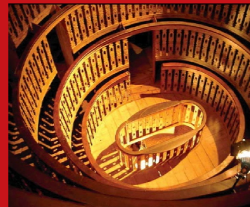
Università di Padova - Palazzo del Bo - Palco superiore

Corso di perfezionamento in Comunicazione emotiva e relazione terapeutica (di aiuto o di cura) nelle professioni sanitarie e sociali